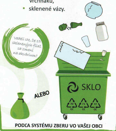
PODĽA SYSTÉMU ZBERU VO VAŠEJ OBCI