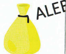
PODĽA SYSTÉMU ZBERU VO VAŠEJ OBCI