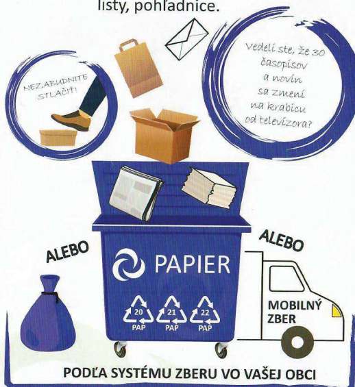
PODĽA SYSTÉMU ZBERU VO VAŠEJ OBCI