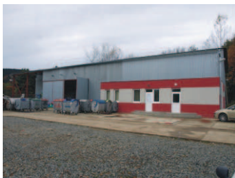
Stredisko triedenia odpadov