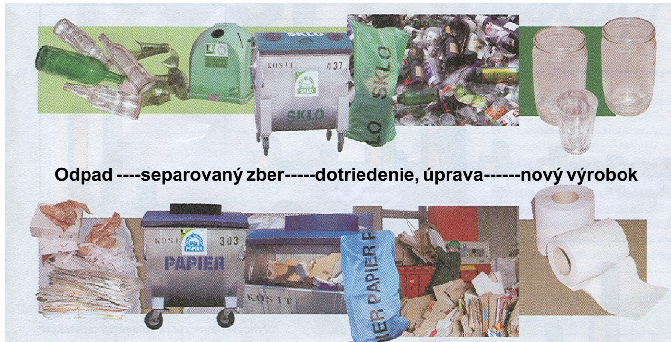
Odpad ----separovaný zber----dotriedenie, úprava-----nový výrobok

Mesto Bardejov pripravilo projekt "Separovaného zberu komunálnych odpadov v Regióne Bardejov", po predchádzajúcich konzultáciách, záväzných stanoviskách jednotlivých štatutárov mikroregiónov, obcí, príslušných zastupiteľstiev a dňa 21.12.2004 podalo žiadosť o jeho finančnú podporu z Recyklačného fondu. Mesto Bardejov uzatvorilo 23.11.2005 zmluvu o poskytnutí prostriedkov z Recyklačného fondu, v ktorej v zmysle zmluvných podmienok fond poskytne žiadateľovi účelovú dotáciu vo výške 7,314 mil. Sk, na úhradu časti nákladov (cca 69 %) spojených s realizáciou projektu.